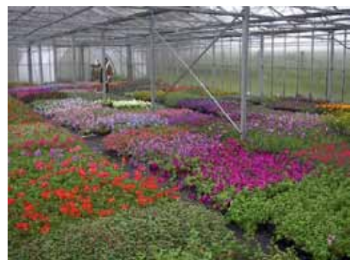
Le spectacle offert par le travail des jeunes est un régal pour les yeux.

Dès le mois de février, confrontés aux exigences des plantes, les jeunes s'arment de patience pour semer, repiquer, arroser, nourrir et soigner plus de 30.000 plantes et 60 variétés de fleurs, sous la supervision des responsables d'atelier et des éducateurs investis dans le projet. Début mai, le week-end portes ouvertes de l'IPPJ inaugure la période de vente. Au cours de ces deux jours, les jeunes s'affairent à présenter fleurs, plants de légumes ou confitures aux visiteurs en fournissant toutes les explications nécessaires à leur conservation ou à leur culture. Dès l'été, les serres accueillent tomates, poivrons, aubergines, courgettes... dont la récolte sera proposée à la vente au personnel de l'IPPJ ou sur des marchés. Chaque mercredi en effet, un groupe de jeunes accompagnés par des membres de l'équipe s'installe sur