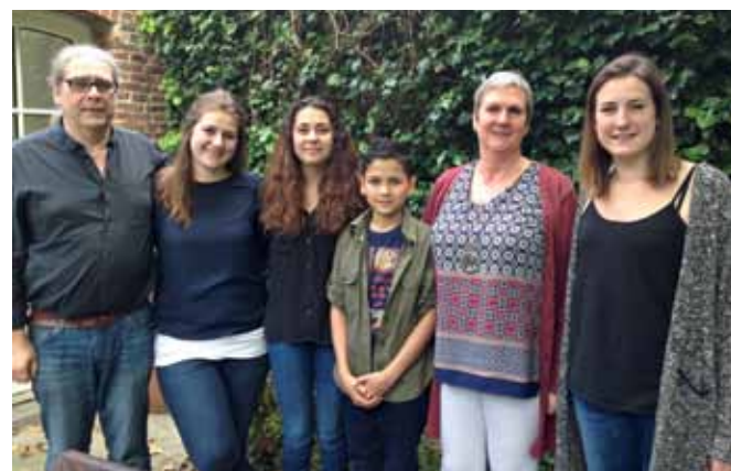
3. et 4. Prénoms d'emprunt.